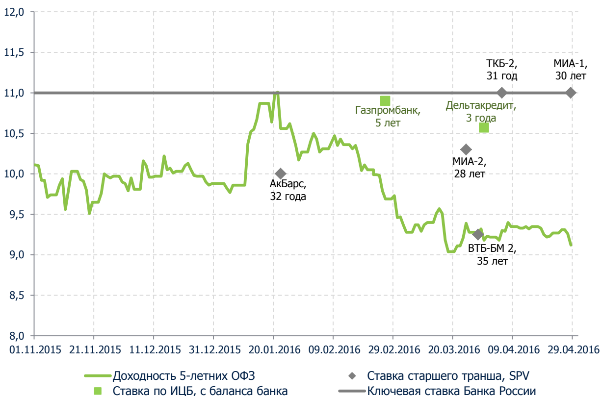
Рис. 1. Сравнение доходности старшего транша по жилищным ИЦБ, 5-ти летних ОФЗ и ключевой ставки Банка России за последние 6 месяцев