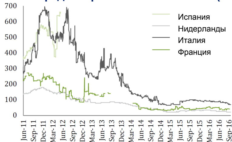
Б.п. Спрэды европейских AAA ABS (1-4 года)