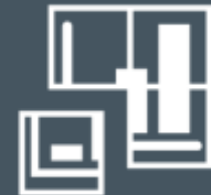
Услуги по структурированному финансированию