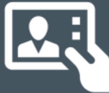
Управление персоналом и расчет заработной платы