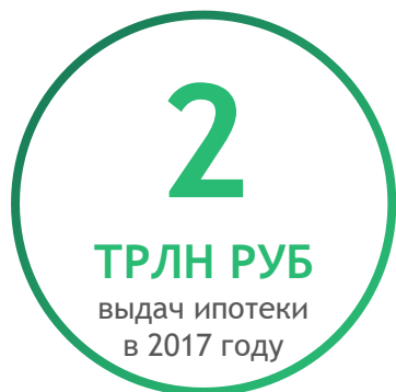
Распределение выдач ипотеки

Развитие ипотеки важно для финансового рынка