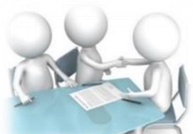
Схема расчетов с использованием счета эскроу